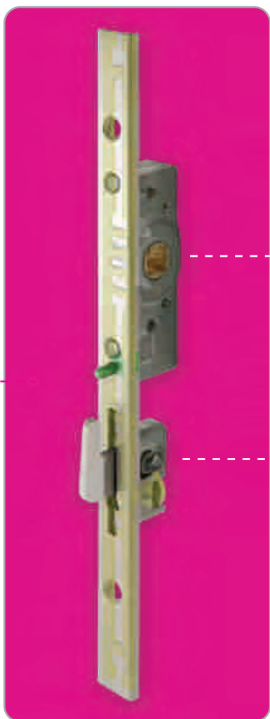
OPÇÃO A / OPCIÓN A > Puxador de janela Manilla