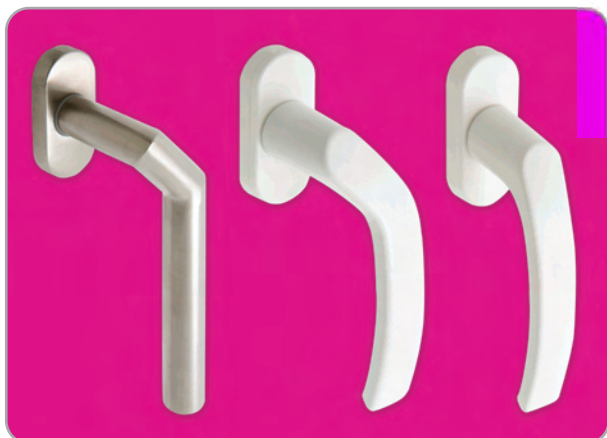
OUTRAS OPÇÕES / OTRAS OPCIONES > Puxador de janela Manillas